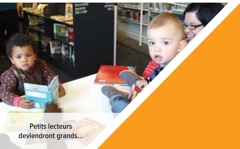
Petits lecteurs deviendront grands...

Avec ses couleurs vives et son mobilier conçu à l'échelle des enfants, le coin des petits a été très populaire. Nulle autre que Fanfreluche s'était déplacée pour lire des contes à son jeune public. Il ne fait aucun doute que de magnifiques moments seront vécus dans cet espace.