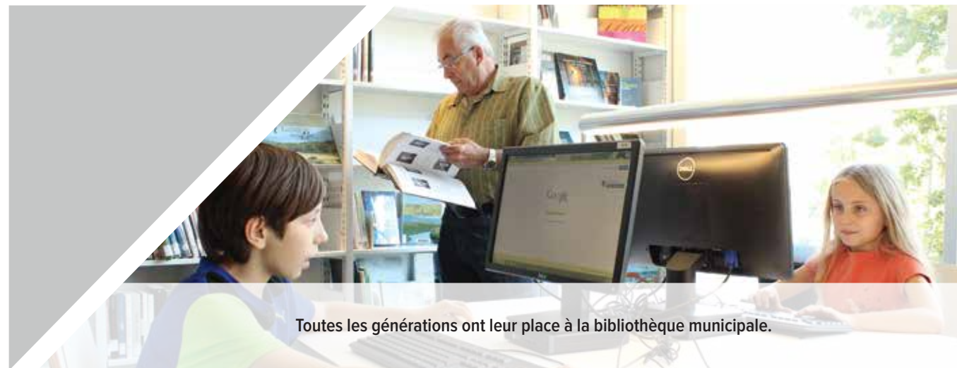
Toutes les générations ont leur place à la bibliothèque municipale.