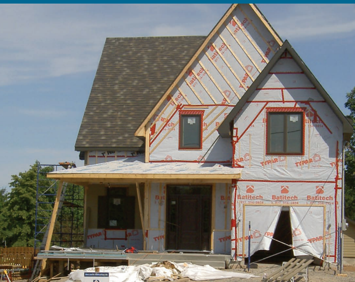
Janvier 2018

Les informations contenues dans le présent dépliant ont pour objectif de favoriser une meilleure compréhension du programme d'accès à la propriété et à la construction de logements. Cependant, seules les dispositions du règlement relatif à ce programme énoncent officiellement les diverses modalités et les mesures pour s'y conformer.