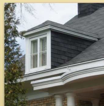
Lucarne à croupe Maison Bernatchez • Trame 4