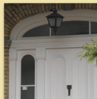
Imposte Maison Bernatchez • Trame 4