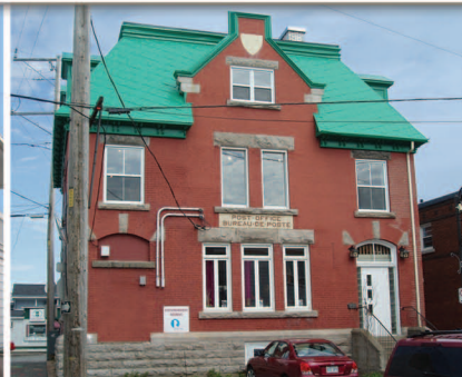
TRAME 8 Ancien bureau de poste 118, rue Saint-Jean-Baptiste Est