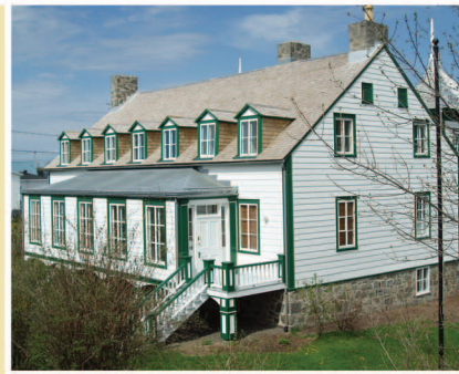
TRAME 9 Maison sir Étienne-Paschal-Taché 37, avenue Sainte-Marie