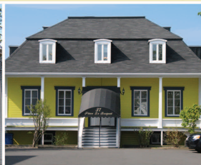
TRAME 12 Maison Thibault 37, rue Saint-Jean-Baptiste Est