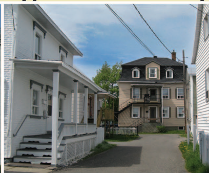
TRAME 15 Rue Saint-Augustin