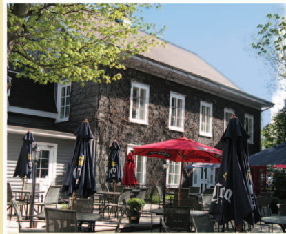
TRAME 10 Maison Joseph-Octave-Beaubien 100, rue Saint-Jean-Baptiste Est