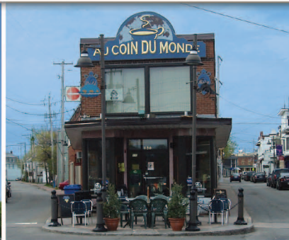
TRAME 6 Jonction des rues Saint-Jean-Baptiste et Saint-Thomas