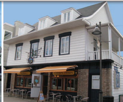
TRAME 7 Maison Michon 129, rue Saint-Jean-Baptiste Est