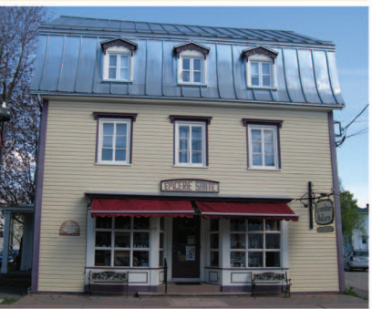
TRAME 19 Maison Maxime-Dubé 100, rue Saint-Thomas