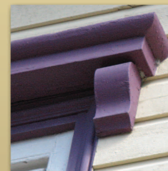
Moules de Montmagny Maison Maxime-Dubé • Trame 19