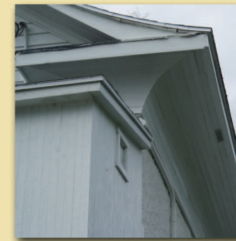
Larmier cintré Maison Bernatchez • Trame 4