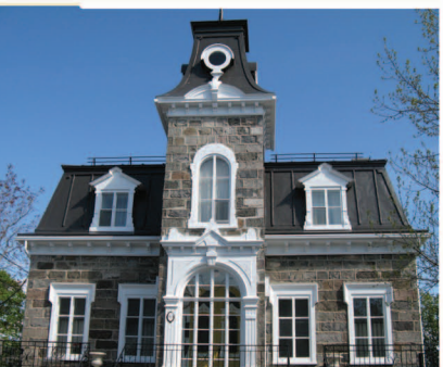
TRAME 18 Maison Charles-Poliquin 90, rue Saint-Thomas