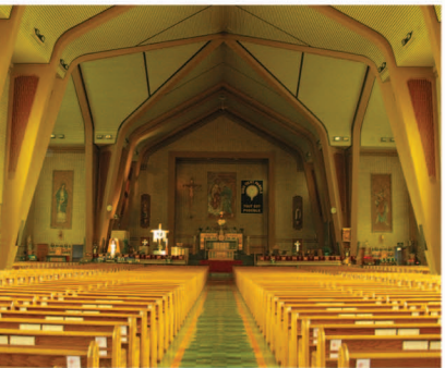
TRAME 20 Intérieur de l'église Saint-Thomas VISITES JUSQU'À 17 H