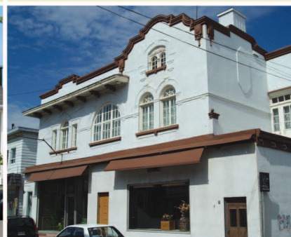
TRAME 11 Maison Joseph-Ludger-Gagnon 93, rue Saint-Jean-Baptiste Est