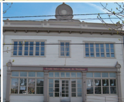
TRAME 13 Ancien bâtiment administratif de l'usine Amable-Bélanger 10, rue Saint-Jean-Baptiste Est