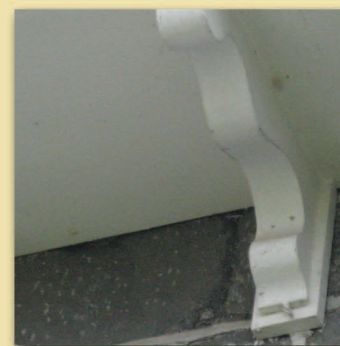
Console en forme de volute Presbytère • Trame 3