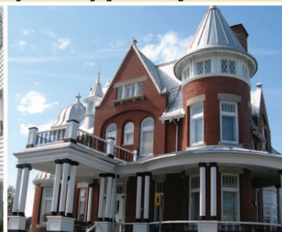
TRAME 14 Maison Amable-Bélanger 5, rue Saint-Jean-Baptiste Est