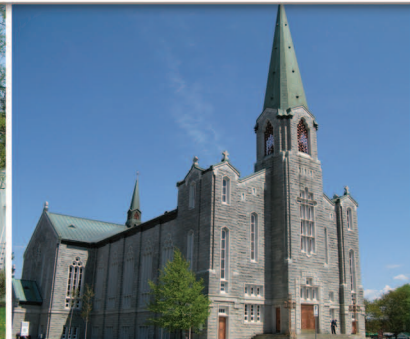
TRAME 5 Église Saint-Thomas 145, rue Saint-Jean-Baptiste Est