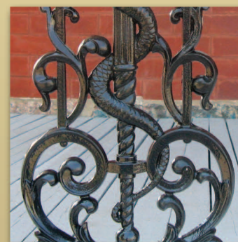
Fer de galerie Maison Amable-Bélanger • Trame 14