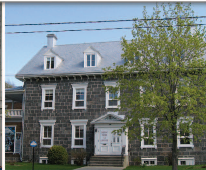
TRAME 3 Presbytère de Saint-Thomas 140, rue Saint-Jean-Baptiste Est