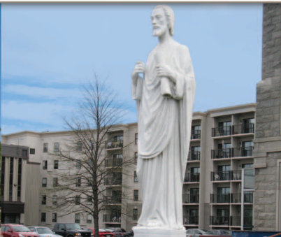
Statue de Saint-Thomas