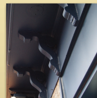
Modillons Maison Michon • Trame 7