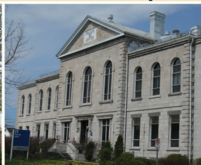
TRAME 16 Palais de justice 25, rue du Palais-de-Justice