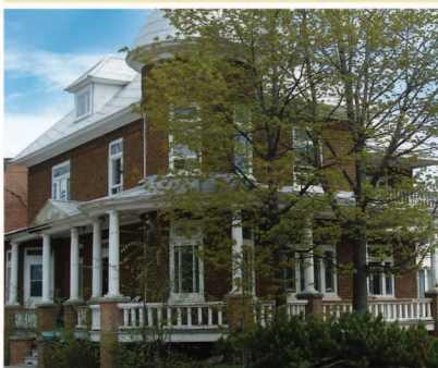
TRAME 17 Maison Albert-Normand 77, avenue de la Gare