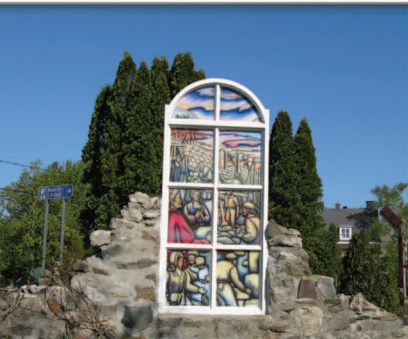
TRAMES 1-2 Les origines de Montmagny Monument commémoratif du 350 e anniversaire de Montmagny