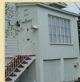
Tambour fenestré Maison Bernatchez • Trame 4