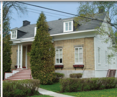
TRAME 4 Maison Nazaire-Bernatchez 32, avenue de l'Église