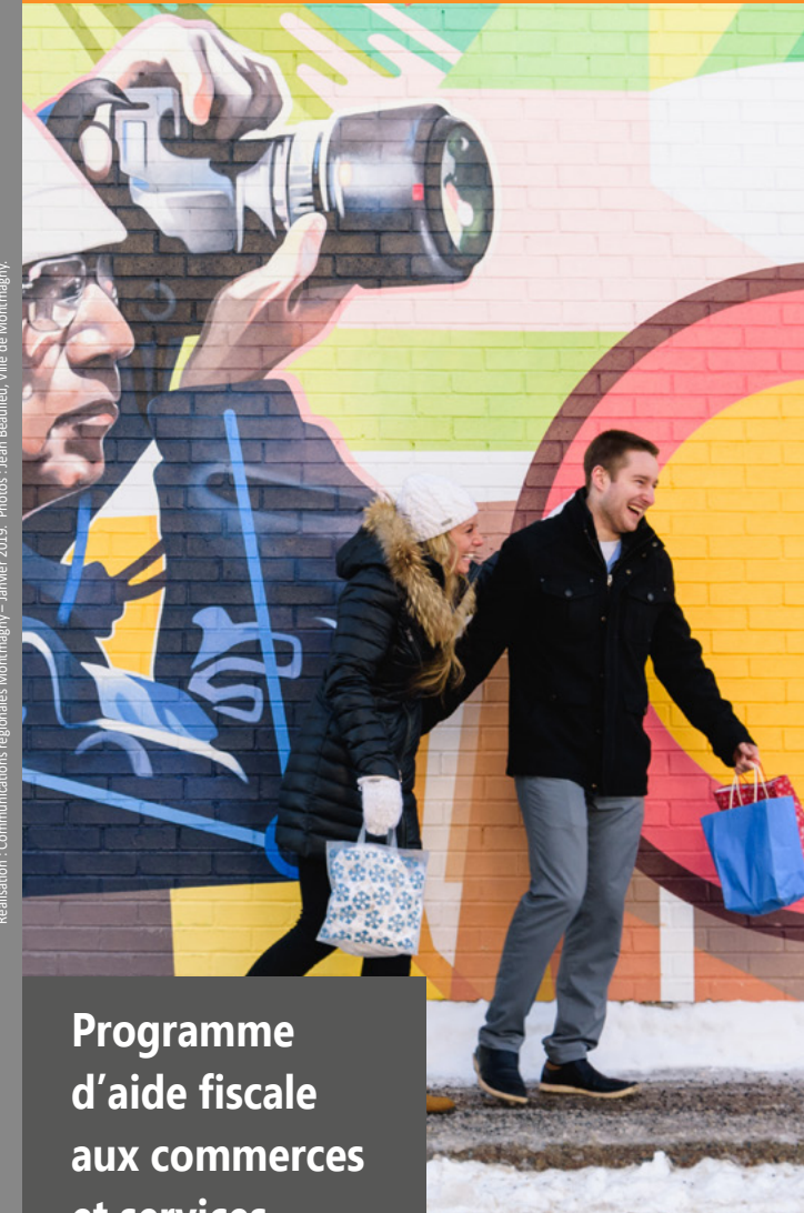
Réalisation : Communications régionales Montmagny - Janvier 2019.

Programme d'aide fiscale aux commerces et services